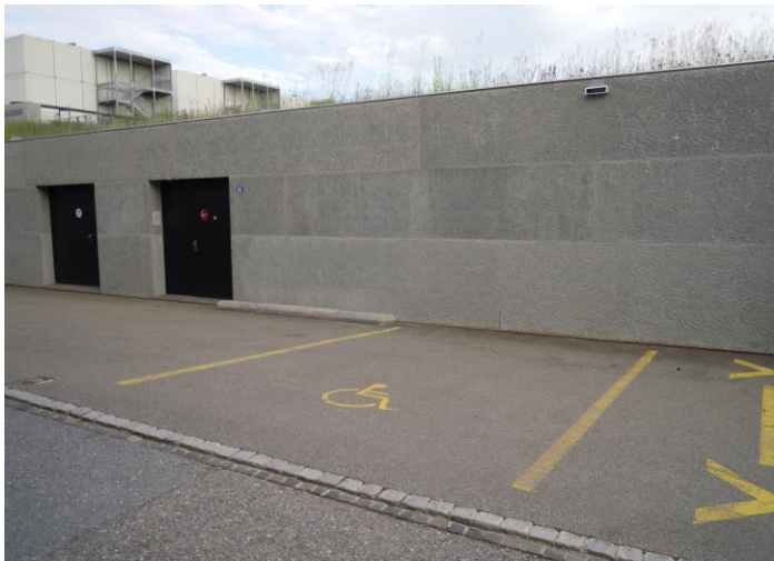
Abbildung 2 Sporthalle

Ein weiterer barrierefreier Parkplatz befindet sich vor den Sportanlagen.