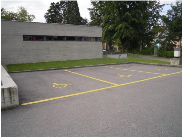
Abbildung 1 Hauptgebäude

Auf dem Campus befinden sich barrierefreie Parkplätze (gemäss Campusplan Seite 4)