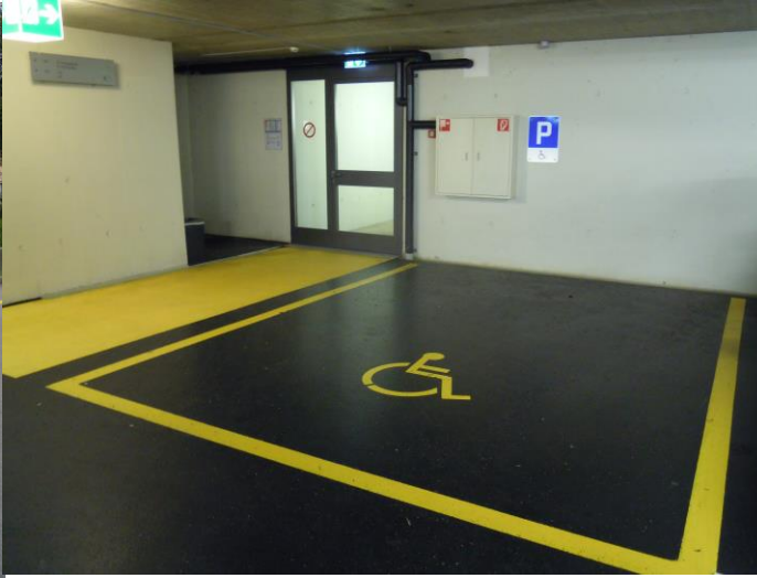
Abbildung 2 Tiefgarage 01

Die Parkplätze wurden den Normen entsprechend konzipiert, um das ungehinderte Ein- und Aussteigen zu ermöglichen. Beim Benützen dieser Parkplätze ist eine gültige IV-Parkkarte im Fahrzeug gut sichtbar aufzulegen. Informationen über die IV-Parkkarte finden Sie unter: