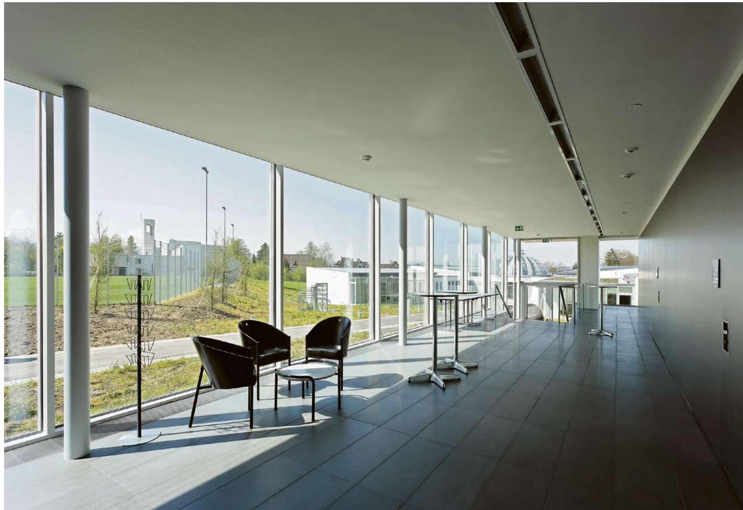
Hans Ulrich Auditorium: Hell und freundlich präsentiert sich der neue Seminartrakt.