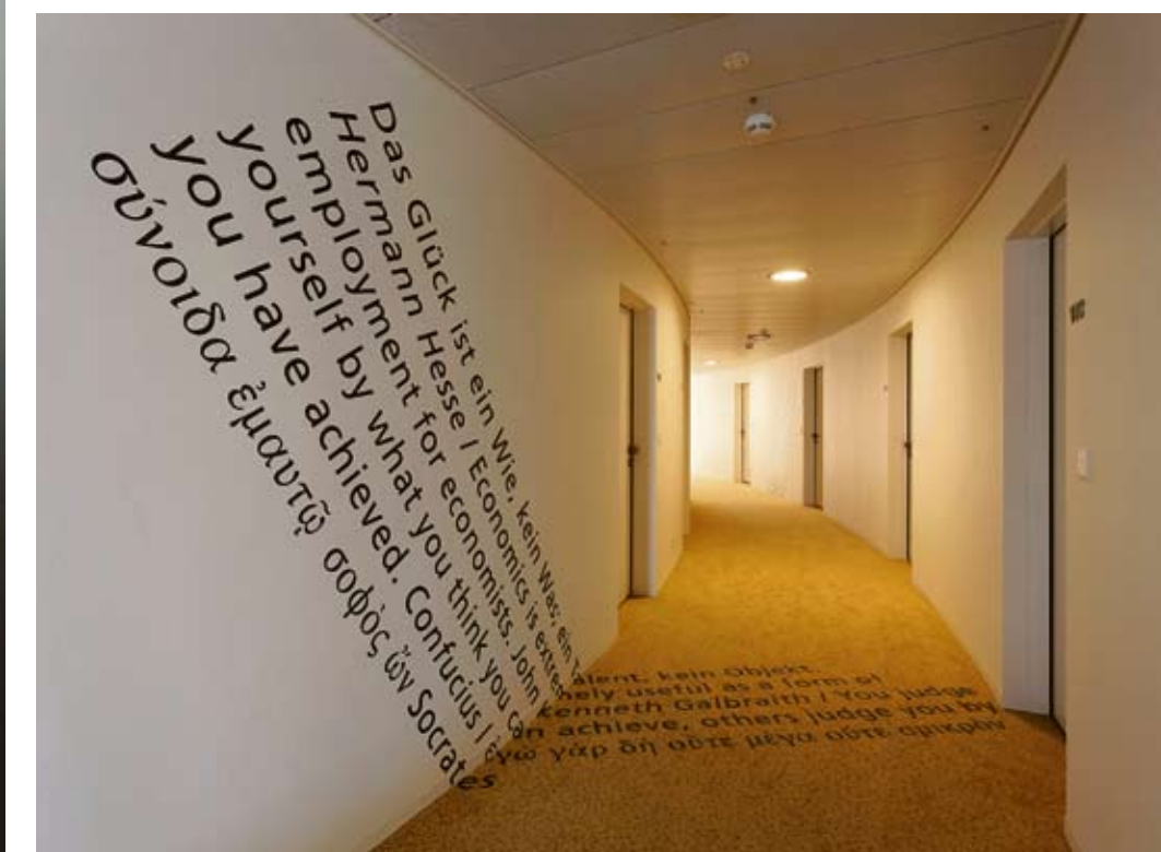
Kunst am Bau in den Gängen des HSG Alumni Hauses.