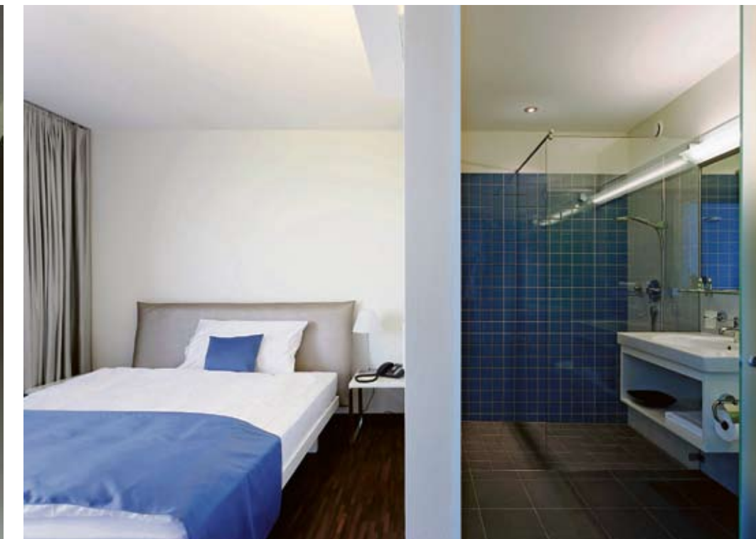
Das HSG Alumni Haus bietet 54 stilvolle Einzelzimmer mit Bad an.